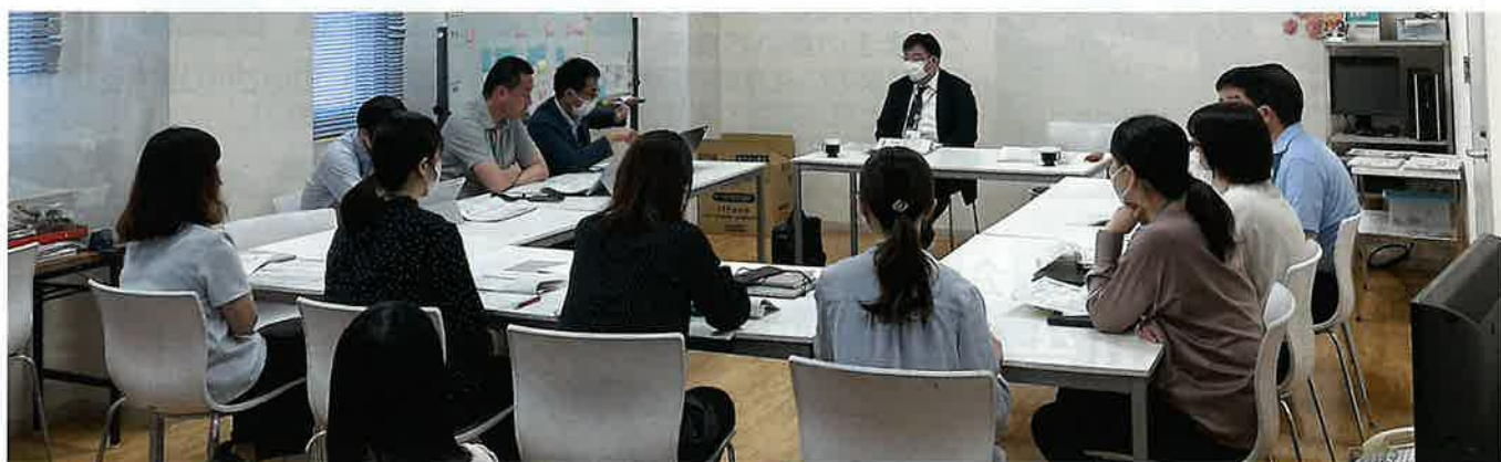
▲キャッシュレス納付導入サポートの様子