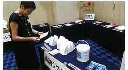
▲参加企業がPRできる展示コーナー