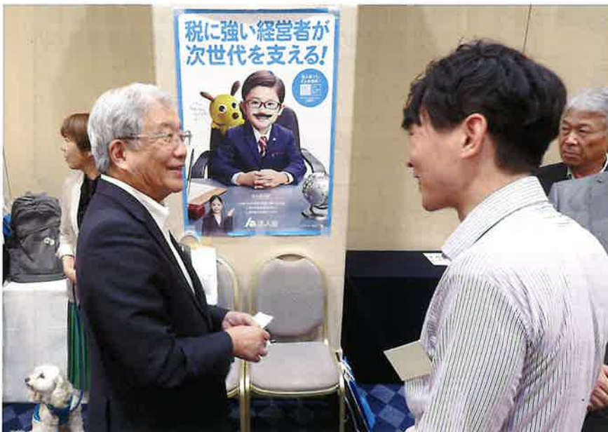
▲大塚会長との名刺交換