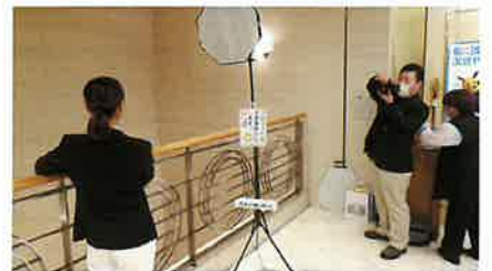
▲新規入会企業さんによる写真撮影の様子