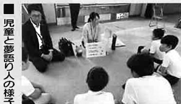
児童と夢語り人の様子