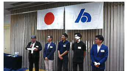
▲支部ごとの入会者紹介と自社PRの様子

今後、各支部でも独自の異業種交流会や研修会、その他催しが開催されます。ご案内の折には、ぜひご参加ください。