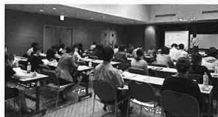
▲「会計実務コース」の開催風景

経理担当者養成講座「会計実務コース」と「社会保険実務コース」を、それぞれ7月17日と7月23日に男女共同参画推進センター(コムズ)にて開催しました。本講座は、新年度を迎えて新たに経理業務に携わる方、会社を設立した方、もう一度基礎から勉強したい方を対象に、経理の基礎から決算処理、社会保険・労働保険の実務について事例を盛り込んだ内容となっており、多くの受講者から毎年好評をいただいております。今年度も感染症等予防対策をとりながら、会場での現地開催とZOOMによるオンライン同時配信により、会場へ来られなくてもインターネットの環境があれば、自社で受講が可能となるよう基礎的な内容を各1日に凝縮し開催しました。