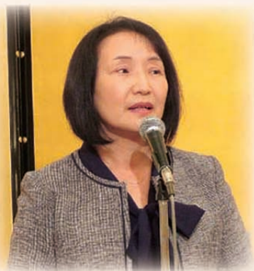
税理士会並木支部長