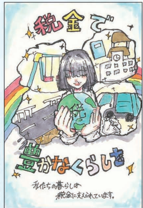
表町小学校 大勝利雪