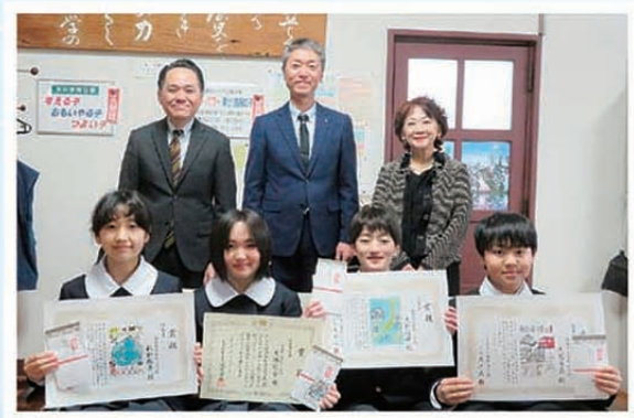
左から福田税務署長、山岸校長、下条女性部会長