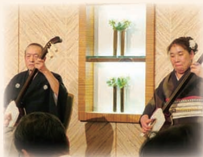
津軽じょんがら節