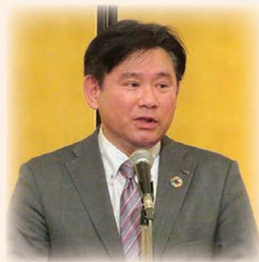
大同生命藤野新潟支社長