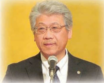
笠輪税理士会長岡支部長