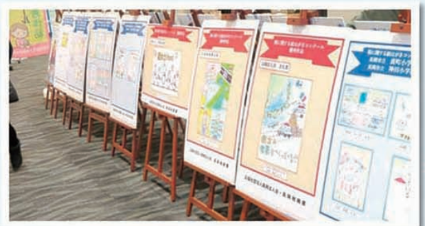
表彰作品の展示(リバーサイド千秋)