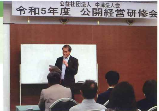
公益社団法人 中津法人会 令和5年度 公開経営研修会