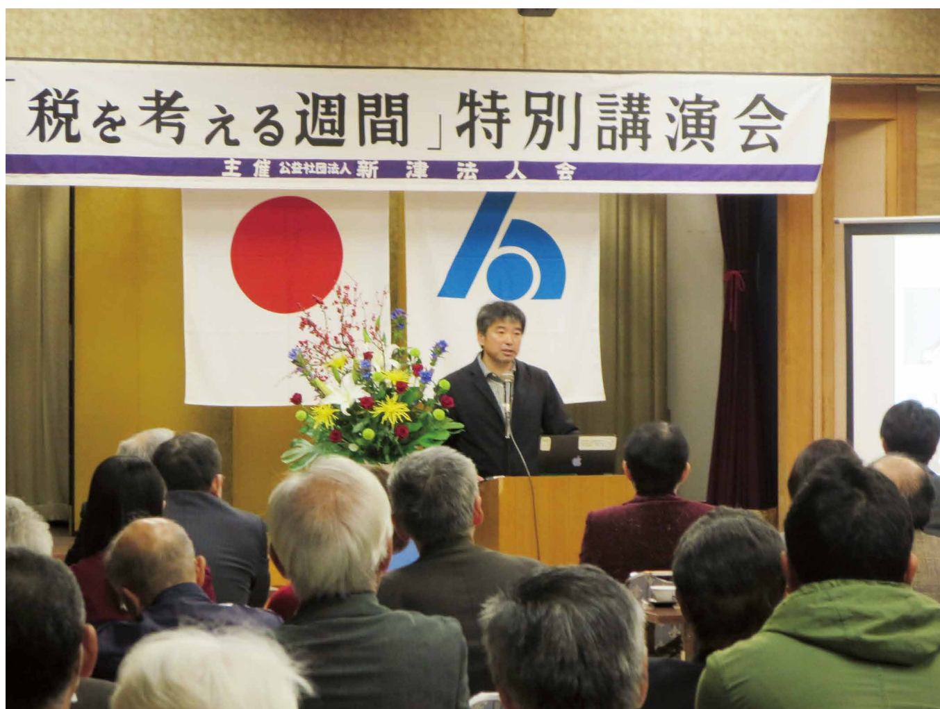
「秋の特別講演会」 令和元年11月13日