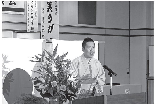
H28.11.11 秋の特別講演会／笑うが一番 (林家木久蔵氏)