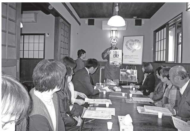
H28.10.18 企業視察研修 (山崎靴屋株)