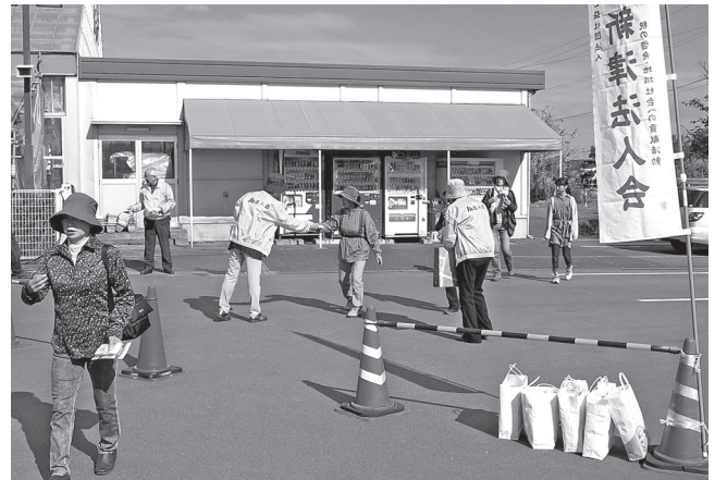
H28.10.15 産業祭でのポケットティッシュ配り