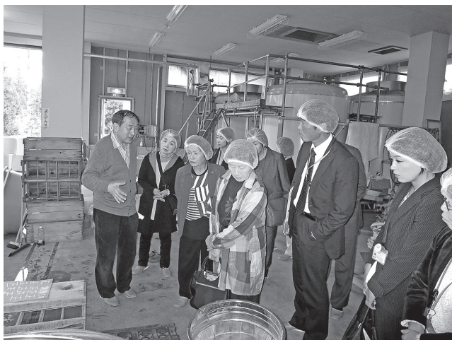
H28.10.18 企業視察研修 (下越酒造株)