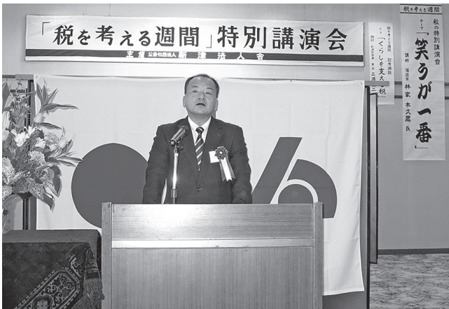
H28.11.11 秋の特別講演会／暮らしを支える税 (新津税務署長)