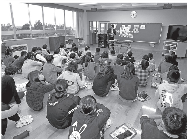
H28.12.13 租税教室 (川東小学校)