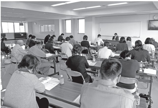
H28.10.13 決算説明会 (新津税務署上席官)