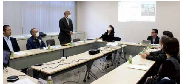
研修委員会(12月13日) 会場: 戸田市商工会館