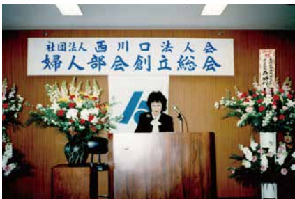
平成7年2月10日 婦人部会創立総会