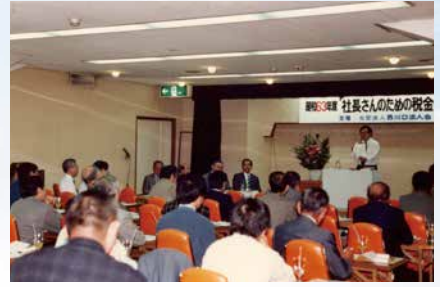
昭和63年10月 「社長さんのための税金セミナー」