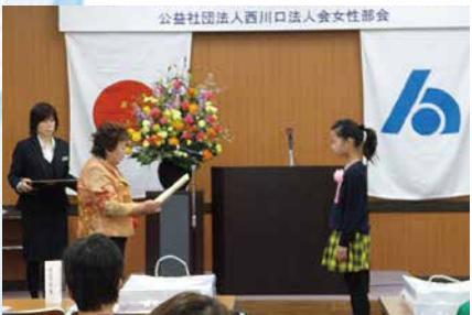
平成27年 女性部会 「税に関する絵はがきコンクール」 スタート