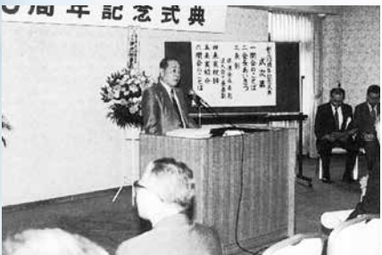
平成4年5月26日 社団法人西川口法人会 創立10周年記念式典