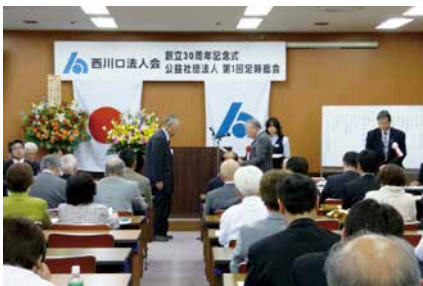
平成25年5月23日 創立30周年記念式並びに 公益社団法人第1回定時総会