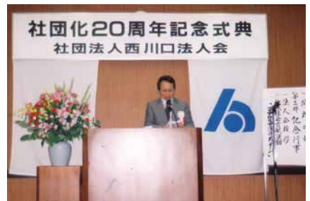
平成14年9月26日 創立20周年記念式典