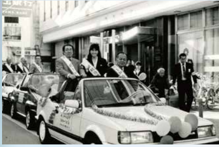
昭和57年～ 「税を考える週間」 広報活動