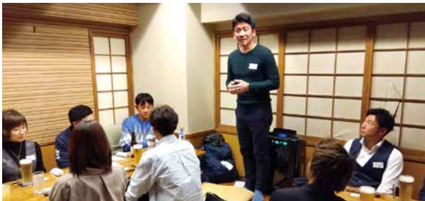
青年部会親睦交流会(12月8日)