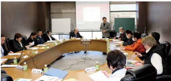
創立40周年記念事業実行委員会(1月16日) 戸田市文化会館