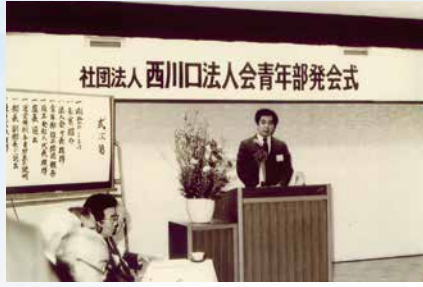
昭和61年3月20日 青年部会創立発会式