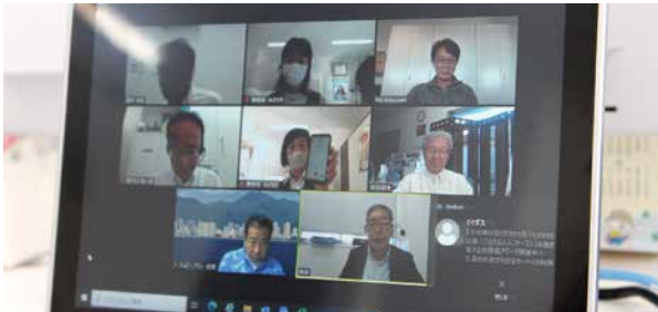
税制委員会(11月8日) リモート開催(zoom)