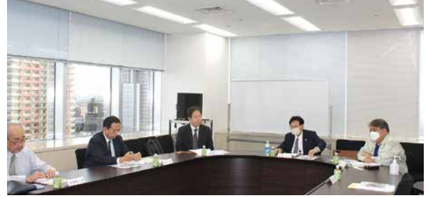
広報委員会(11月6日) 会場: 川口リリア