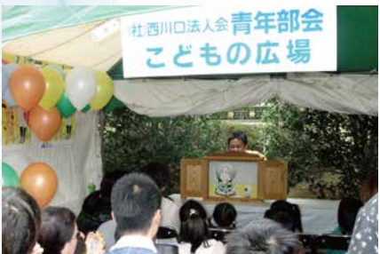
平成21年 青年部会租税教育事業 租税教育用紙芝居 『カッパのいたずら』読み聞かせスタート