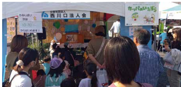
青年部会租税教育(11月3日) 蕨宿場祭り