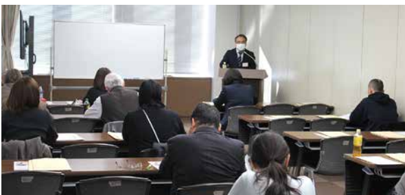
老齢年金制度説明会(12月7日) 講師:浦和年金事務所 会場:川口リリア