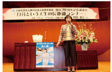
青年部会創立30周年記念講演会 講師：増田明美氏 (スポーツジャーナリスト)