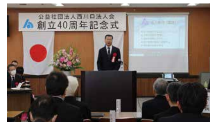
國見課長様による祝辞