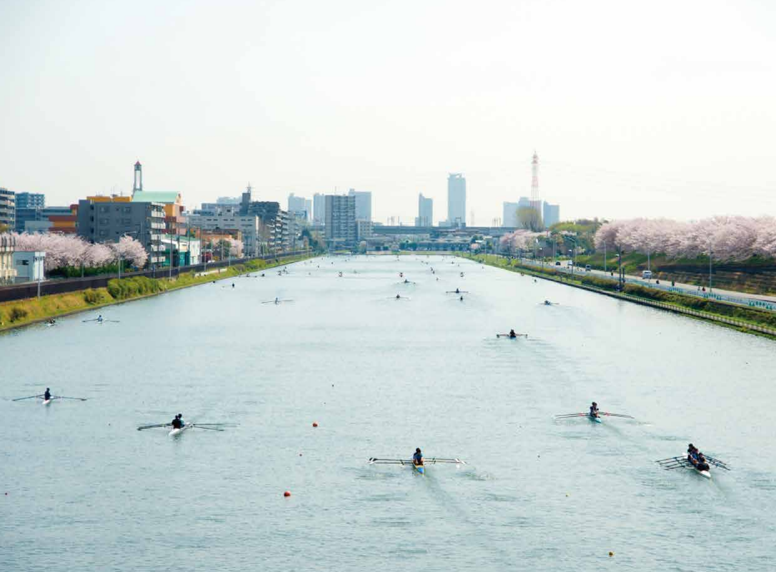
「春が来た」 撮影地:戸田ボートレース