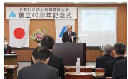
川島会長による式辞