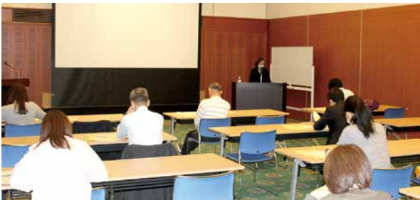
年末調整研修会(11月13日) 講師:西川口税務署担当官 会場:フレンディア