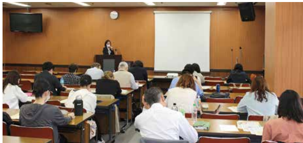
年末調整研修会(11月7日) 講師:西川口税務署担当官 会場:戸田市文化会館