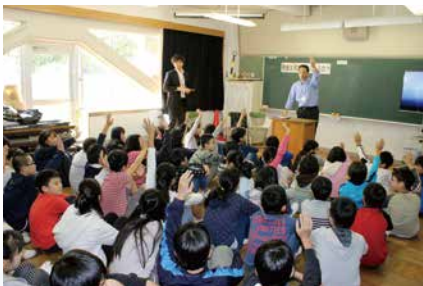
平成28年 青年部会租税教室スタート