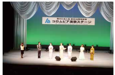
平成25年5月 創立30周年記念事業 「コロムビア演歌ステージ」