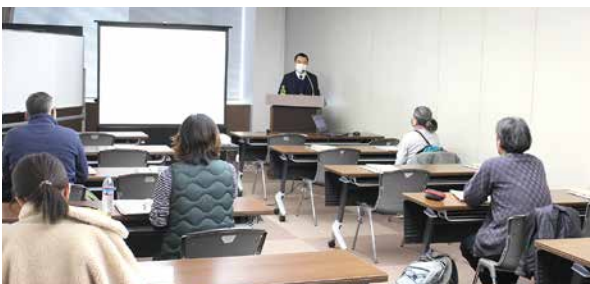
新設法人説明会(1月18日) 講師:西川口税務署担当官 会場:川口リリア