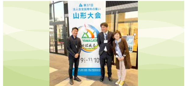
全国青年の集い(11月10日) 山形県