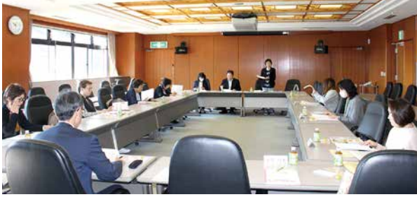
女性部会役員会(11月1日) 会場: 蕨商工会館