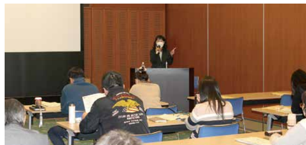
決算法人説明会(12月5日) 講師:西川口税務署担当官 会場:フレンディア