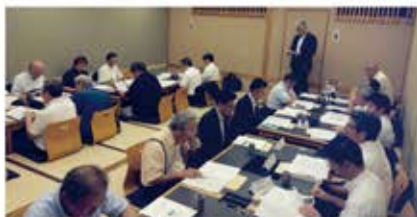
戸田支部役員会(9月20日) 会場:木曾路