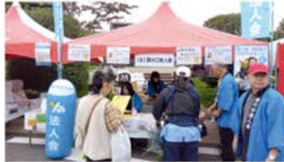
戸田支部 租税教育事業(10月26日) 『税金クイズ』 会場: 戸田市商工祭