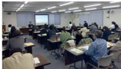
年末調整研修会(11月6日) 講師: 西川口税務署担当官 会場: 西川口税務署