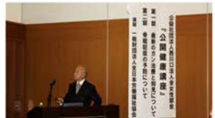
女性部会 健康セミナー(11月19日) 『最新のガン治療と知見について』他 講師: (一財)全日本労働福祉協会 会場: フレンディア