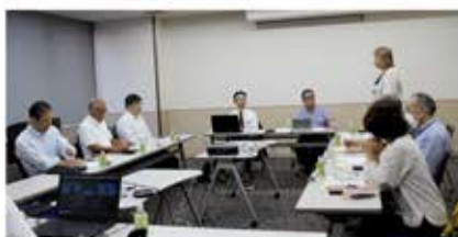
研修委員会(9月26日) 会場:戸田市商工会館