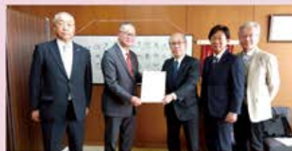
戸田市 石川清明 市議会議長