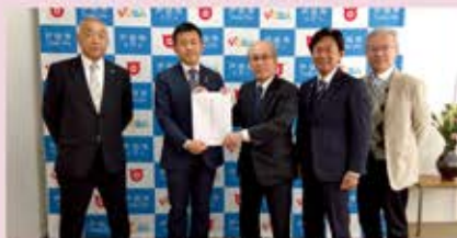
戸田市 菅原文仁 市長