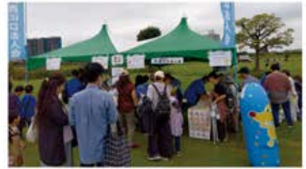
西川口支部 租税教育事業(10月6日) 『税金クイズ』 会場: 荒川ふれあい祭り