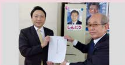
新藤義孝 衆議院議員事務所