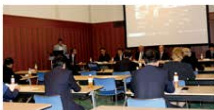
第2回理事会(10月29日) 会場:フレンジア