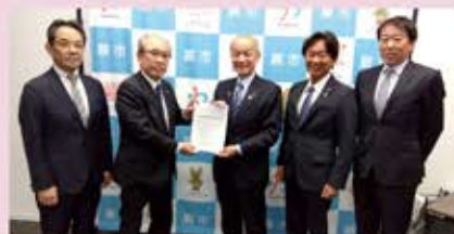
蕨市 頼高英雄 市長