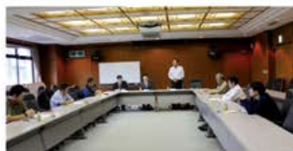
総務委員会(10月18日) 会場:蕨商工会議所