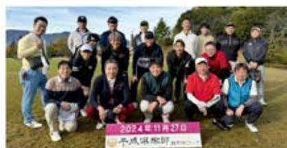
青年部会親睦ゴルフコンペ(11月27日) 会場:平成倶楽部 鉢形城コース