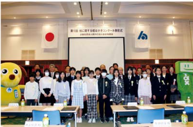
受賞者とご来賓の皆さま