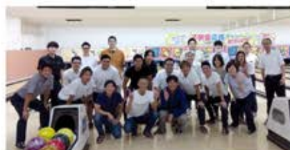
青年部会・税理士会親睦ボウリング大会 (9月27日)会場:川口スプリングスレーン