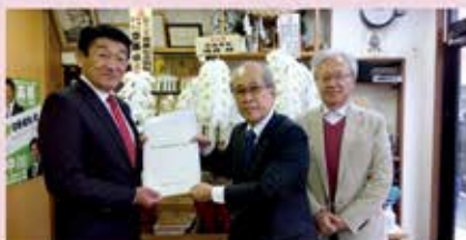
高橋英明 衆議院議員