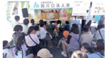
青年部会 租税教育事業(11月3日) 『租税教室用紙芝居の実演』 会場: わらび宿場まつり