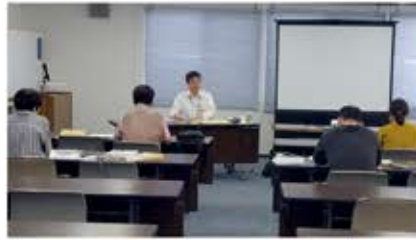
新設法人説明会(9月19日) 講師: 西川口税務署担当官 会場: 西川口税務署