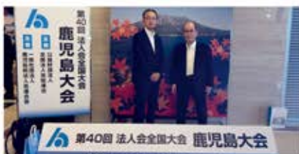
法人会全国大会(10月3日) 開催地:鹿児島市 (右より川島会長、事務局長)