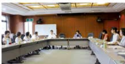
女性部会役員会(9月12日) 会場:蕨市商工会議所