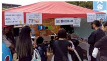
青年部会 租税教育事業(10月27日) 『租税教室用紙芝居の実演』 会場: 戸田市商工祭