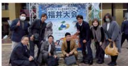
青年部会一泊研修会(11月7,8日) 研修地:福井市、金沢市