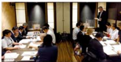
西川口支部役員会(9月5日) 会場:魚星