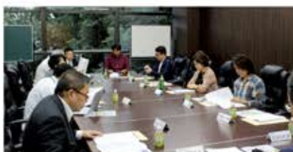
青年部会役員会(10月16日) 会場:戸田市文化会館