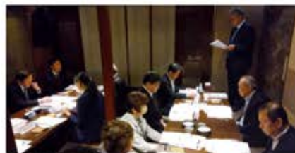
蕨支部役員会(11月28日) 会場:忍家