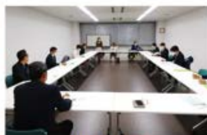
研修委員会 12月1日(水)