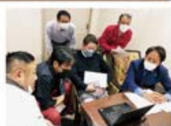
「租税教育プレゼンテーション」 打ち合わせ会議の様子

ご来賓：大分税務署長及び法人1統括官 大分市財務部長 大同生命保険株式会社大分支社長 AIG損害保険株式会社大分支店長 アフラック生命保険株式会社大分支社長