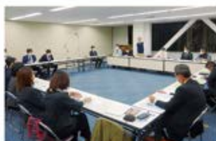
厚生委員会 11月16日(火)