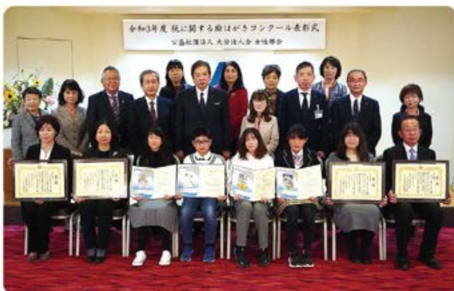
令和3年度 税に関する絵はがきコンクール表彰式 集合写真