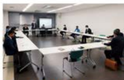
租税教室委員会 11月11日(木)