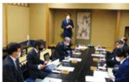
12月6日(月)「インボイス制度」 長浜支部研修会