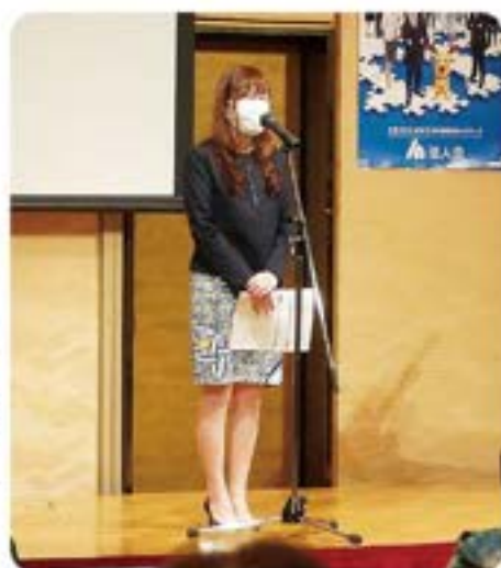
女性部会長より開催の挨拶