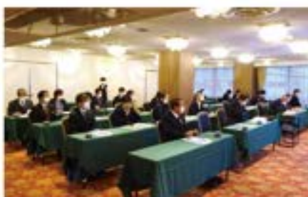
12月7日(火)「インボイス制度」 中央東・中央西支部合同研修会