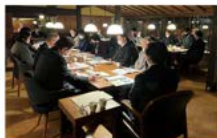
12月8日(水)「マーケティングセミナー」 西ブロック研修会