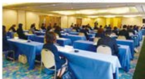
組織・厚生合同委員会