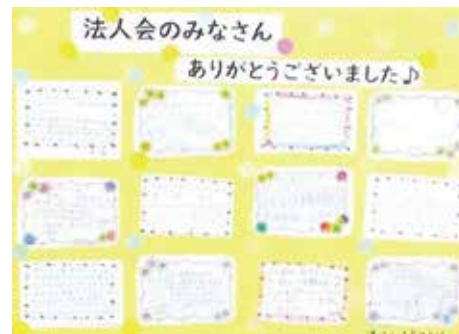
↑ 寄せ書きが届きました