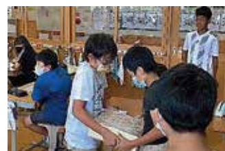
1億円レプリカ体験