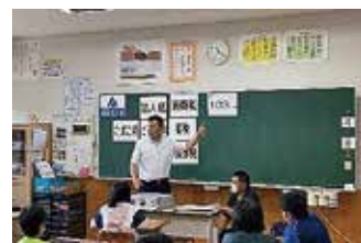
八幡小学校での授業