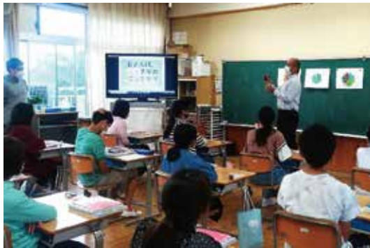
↑「皆さんは税金を納めていますか？」