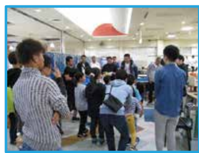
聖ヨゼフ寮児童・生徒交流ボウリング大会