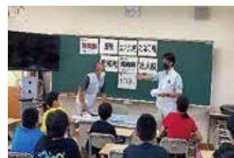
オリジナルパネルの使用