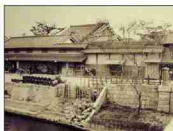
大同生命の礎を築いた 大坂の豪商「加島屋」