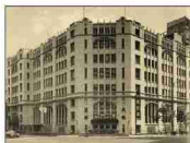
旧肥後橋本社ビル (設計:W・M・ヴォーリス)