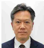
アフラック生命保険㈱ 大分支社長