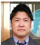
九州共栄ファミリー㈱