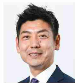
AIG損害保険㈱ 大分支店長

引き続き推進員を中心として会員の皆様の経営にお役立て頂ける情報提供を行って参りますのでよろしくお願い申し上げます。