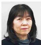
㈱メディカル・アイ・ファミリー