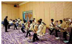
日本製鉄大分吹奏楽団の演奏

研修会・口演会終了後、交流会を開催いたしました。日本製鉄大分吹奏楽団の皆様による演奏で、会場は楽しい雰囲気。コロナの感染状況が落ち着いた時期でもあり、各テーブルでは久しぶりの談笑の輪が見受けられました。(参加者 63名)