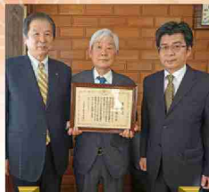
大分税務署長表彰