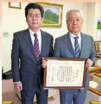
熊本国税局長表彰