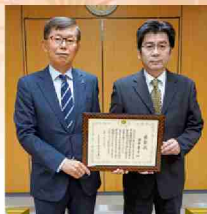
大分税務署長表彰