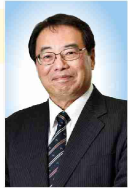
歴史家/作家 加来 耕三 氏