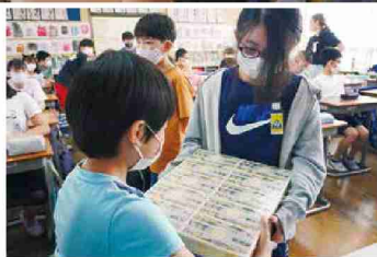
▲1億円レプリカの体験