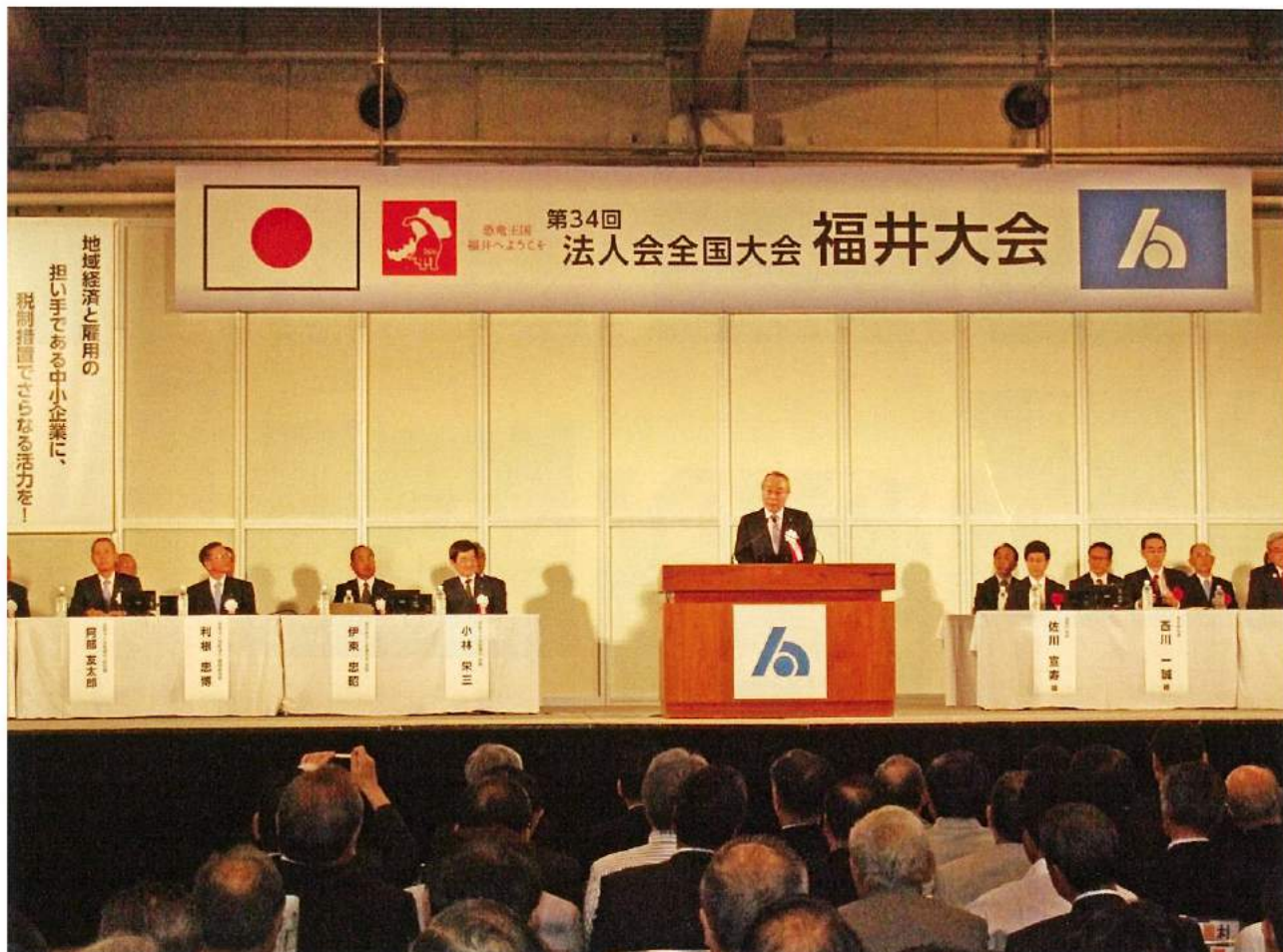
法人会全国大会（福井大会）