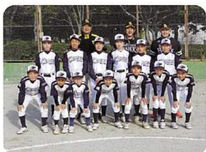
大川ホワイトボーイズ