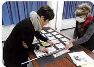
絵はがき貼付作業