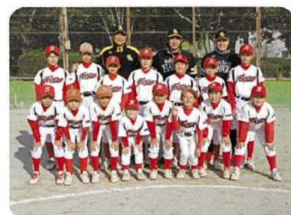
大川リトルホープ