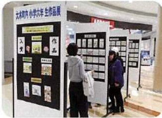
絵はがき展示(イオン大木)