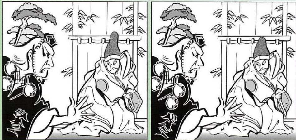
イラストレーター 神谷一郎 作

*左の絵と右の絵には相違点が 7か所あります。 見つかりますか? (答えはP4にあります)