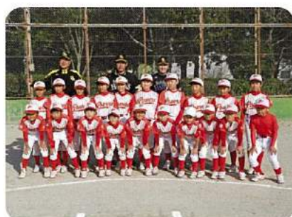
大川ジュニアパワーズ