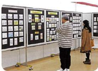
絵はがき展示(ゆめタウン大川)