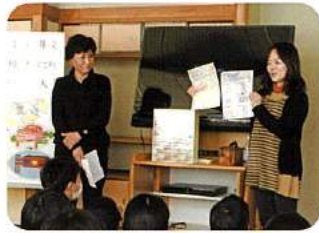
コンクール説明(大川小)