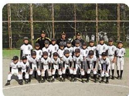
大木ジュニアーズ