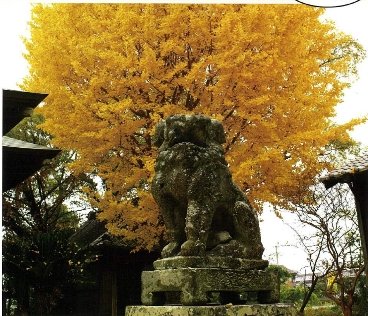
大木町 大藪三島神社のイチョウの木