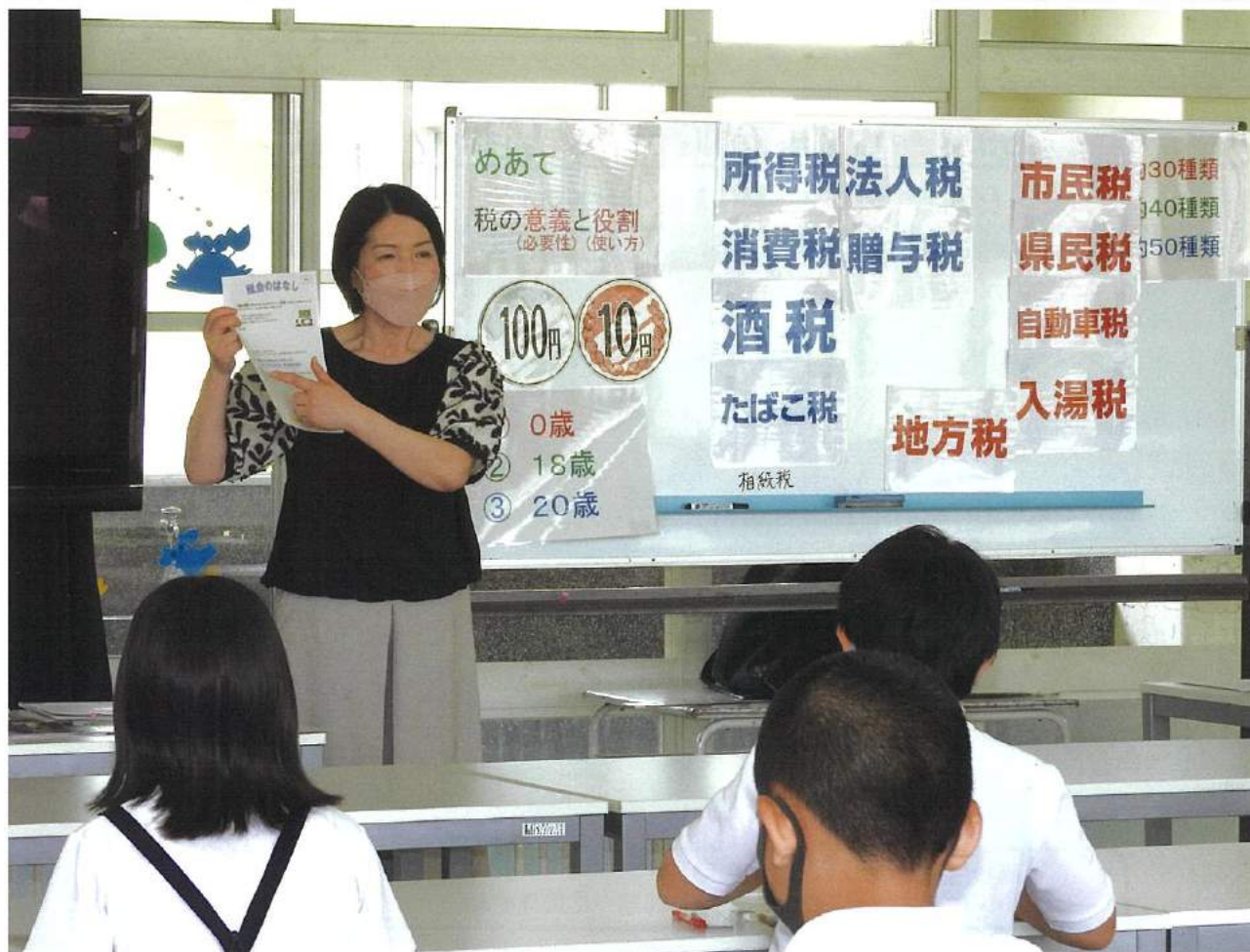
大莞小学校 租税教室