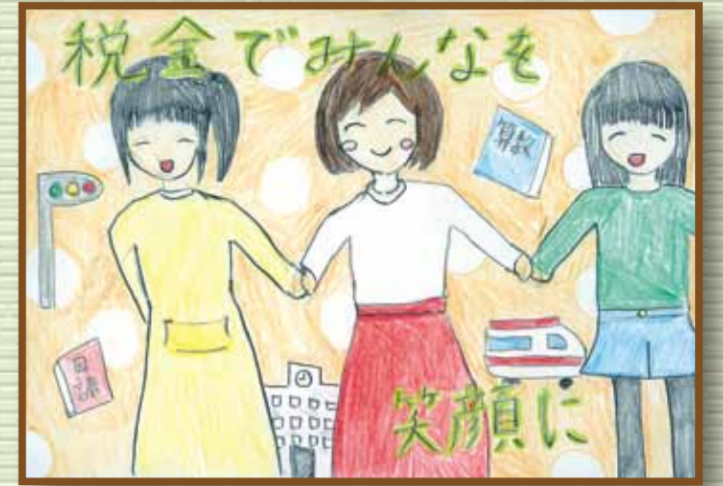
真庭法人会 真庭市立河内小学校 6年