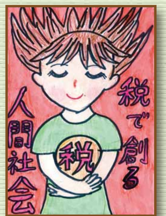
岡山西法人会 吉備中央町立吉川小学校 6年