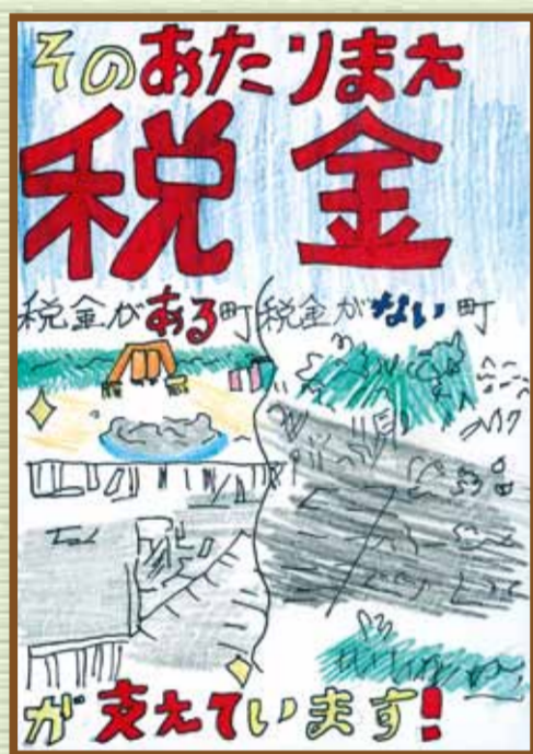
高梁法人会 高梁市立落合小学校 6年