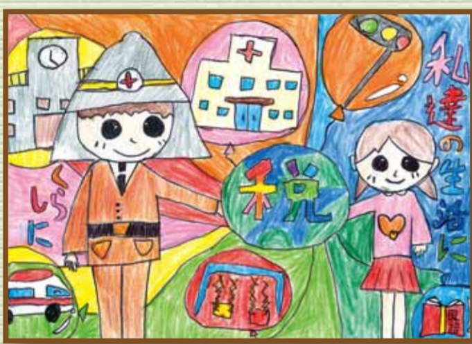
玉野法人会 玉野市立宇野小学校 6年