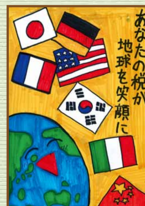
津山法人会 津山市立勝加茂小学校 6年