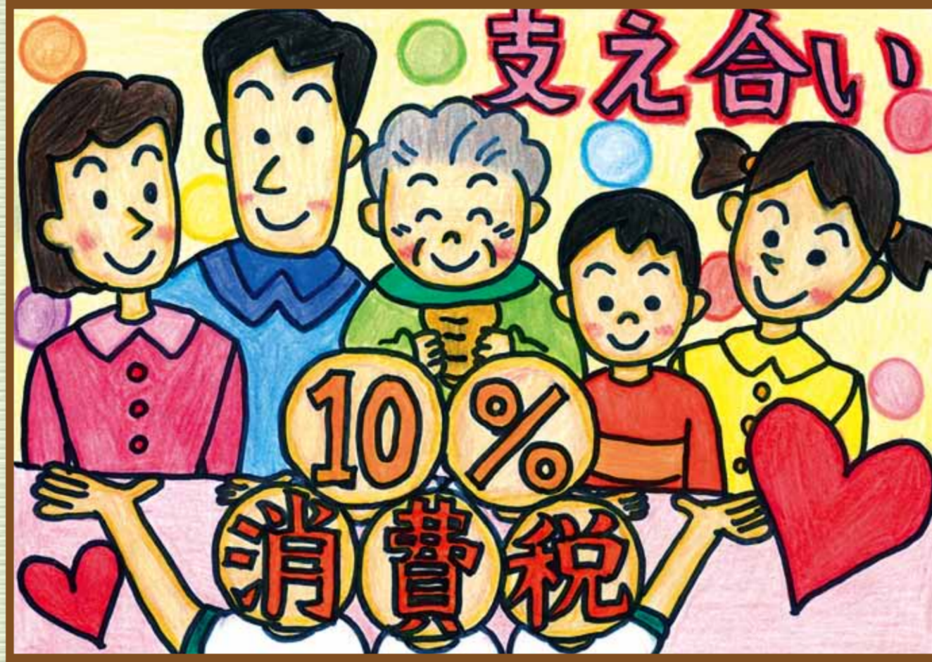
倉敷法人会 倉敷市立老松小学校 6年