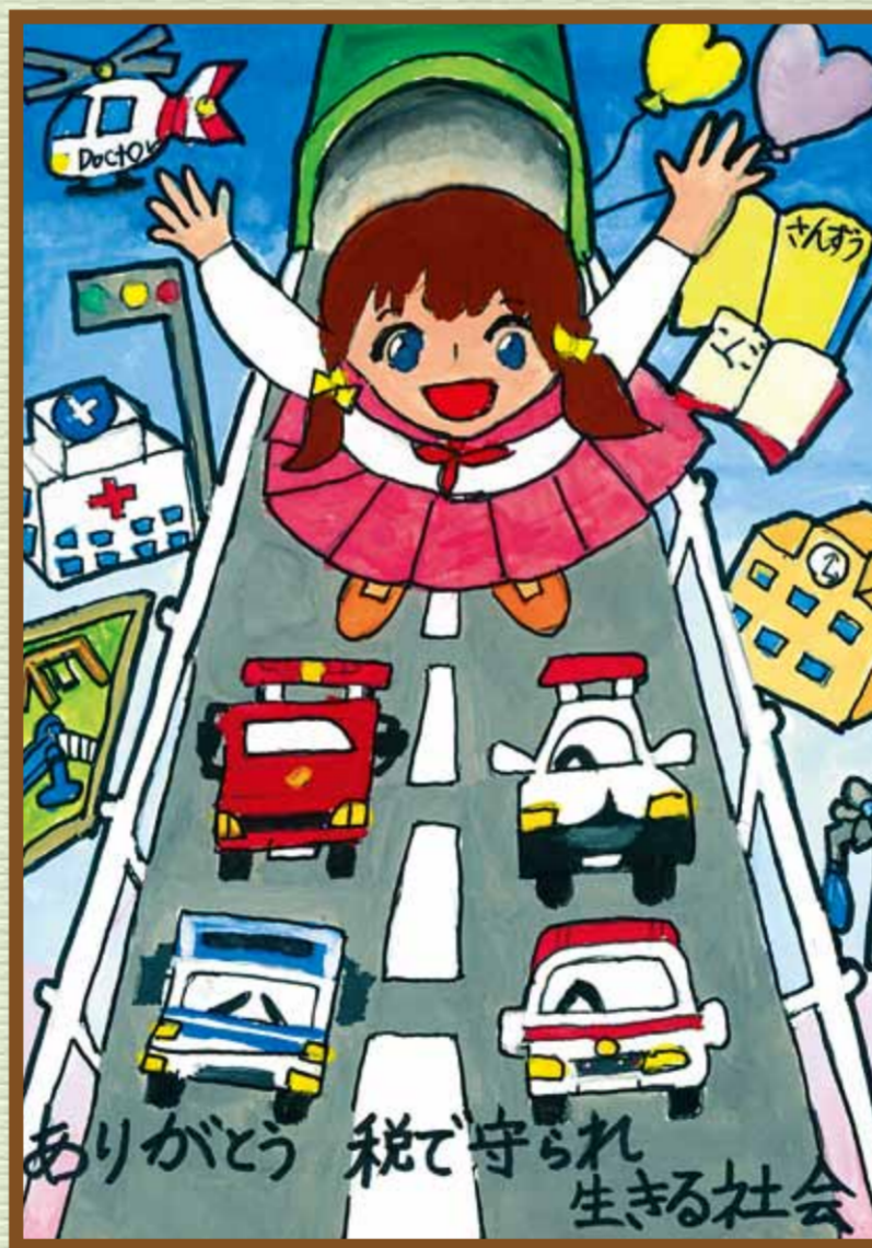
西大寺法人会 岡山市立西大寺小学校 5年