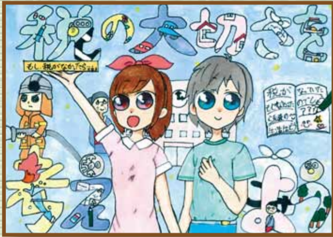
児島法人会 倉敷市立郷内小学校 6年