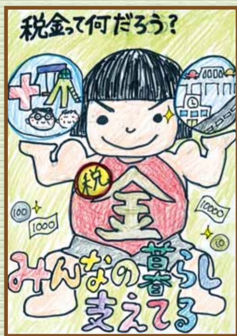
玉島法人会 倉敷市立船穂小学校 6年