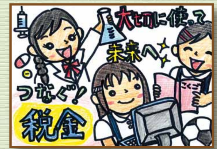
瀬戸法人会 赤磐市立豊田小学校 6年