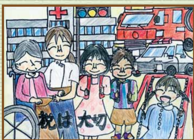
新見法人会 新見市立高尾小学校 6年