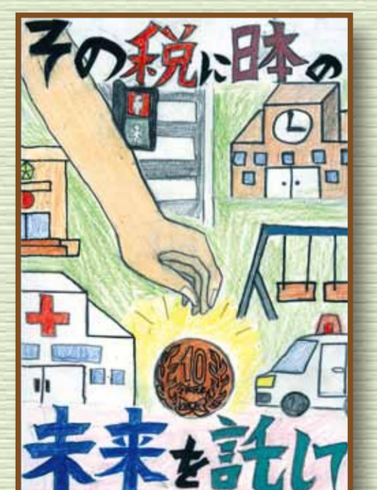
井笠法人会 笠岡市立大井小学校 6年