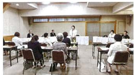
絵はがきコンクールなどについて協議した女性部会全体会議

新型コロナの制限が緩和され、両部会とも積極的な活動を呼びかけました。青年部会は管内小学校で実施している子供向けの租税教室の状況が、女性部会は昨年から日程が変更された絵はがきコンクールの応募状況や審査会などについて話し合われました。