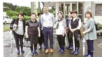
藤里町のアルピオン白神研究所を訪ねた視察研修

栽培はすべて社員が有機農法で行っており、植物を洗浄した排水などでも環境に配慮して活動しているそうです。また、ワイナリーが併設され、化粧品原料として栽培したブドウ「ヤマ・ソービニオン」の未利用部からワインの醸造も行っていました。