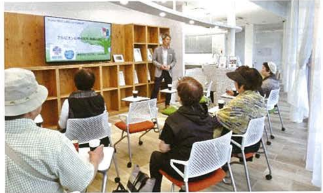
小平所長から説明を聞く女性部会の皆さん