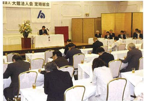
決算や事業報告を承認した総会(6月5日、プラザ杉の子)

令和5年度の事業については、コロナ対応が緩和され影響がなかったことが報告されました。青年部会が担当する小中学生対象の「租税教室」、女性部会が主催する小学生の「税に関する絵はがきコンクール」は開催校、応募数が過去最高を記録しました。特に絵はがきコンクールでは、大館税務署長賞に選ばれた作品が、県内8法人会のトップとなる秋田県法人会連合会会長賞を受賞しました。また、初の企画「大人の租税教室」も好評だったこと