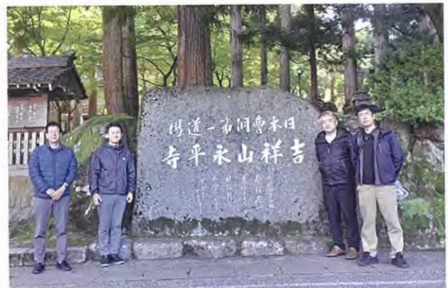
永平寺にも行ってきました