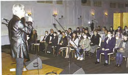
一般市民90人が訪れたダックスムーンのコンサート(大館市のプラザ杉の子)

税を考える週間(11月11日～17日)の社会貢献事業として大館法人会は同13日、一般市民を対象に大館市有