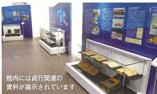
館内には貞行関連の資料が展示されています

町が計画から8年余りかけて整備した待望の施設です。本県側からは発荷峠を下り、湖とぶつかる丁字路交差点付近。湖面から10mほどの小高い丘に、大断面集成材を使った木造平屋の建物と駐車場、緑地広場などが整備されました。約1.8ヘクタールの広さがあります。 施設内は湖を一望できるレストランのほか、特産品やお土産品の販売コーナー、貞行関連の資料展示、観光動画を紹介するシアターなどがあります。通年営業することから紅葉シーズンはもちろん、冬場の誘客効果も期待されています。