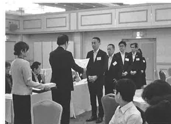
▲会員増強運動にご支援ご協力ありがとうございました