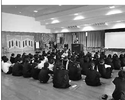
2019.11.15 喜多小学校 (84名対象)

法人会の目的である「税知識の普及、納税意識の高揚」を基本理念に「租税教育活動」を大きな柱と位置付け青年部会員が中心となり「租税教室」を積極的に推進します。『租税教育』の目的は、我が国の時代を担う児童・生徒に対し、国及び地方公共団体の財政を支える租税の意義や役割を認識させ、適正な申告と納税が国民の義務として重要であることを理解させることです。『租税教室』では、税金に関するDVD鑑賞や税金クイズ、また1億円レプリカ体験等、青年部会員が工夫をこらした授業を行い、児童・生徒に税金について楽しく学んでもらっています。