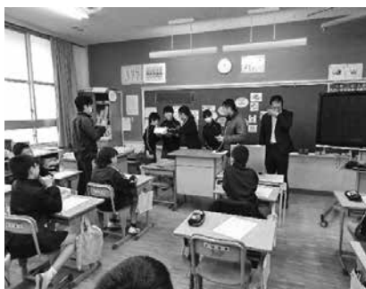
2020.1.16 肱川小学校 (13名対象)