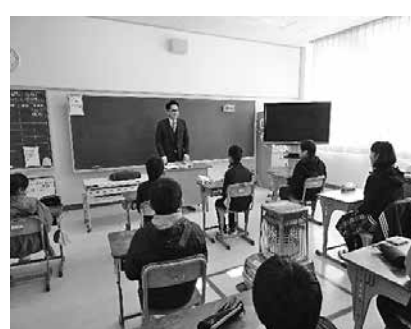
2019.12.4 平野小学校 (9名対象)