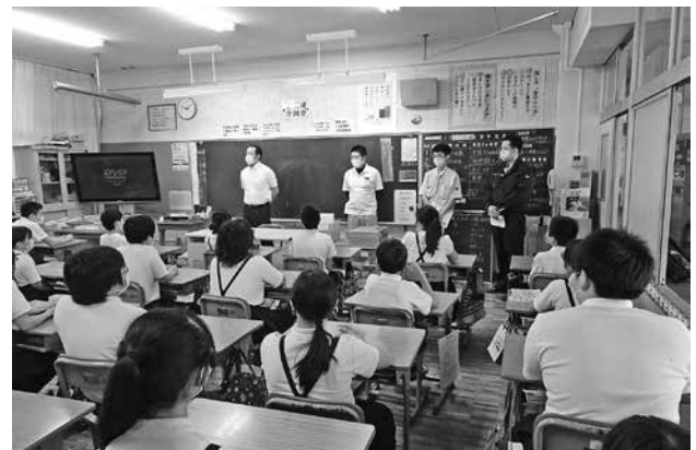
近所のおじさんたち(失礼)青年部会員が講師