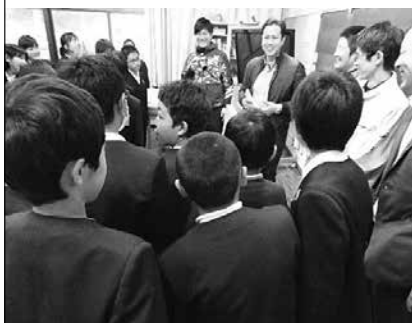
2020.1.14 長浜小学校 (33名対象)