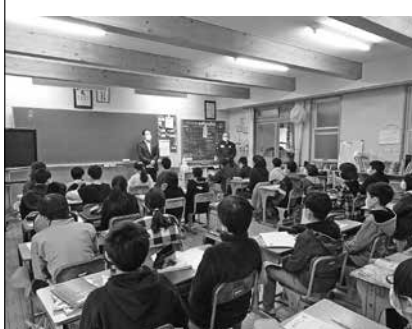
2020.1.31 新谷小学校 (32名対象)

税金DVDを見て、税金のある生活と税金のない生活について比較しながら勉強していきます。