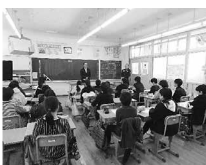
2019.11.29 久米小学校 (24名対象)