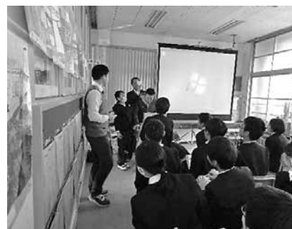
2020.1.22 内子小学校 (61名対象)