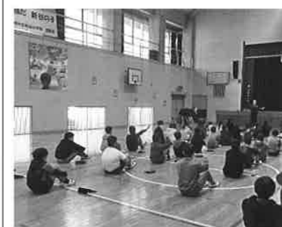
2021.1.19 新谷小学校 (43名対象)