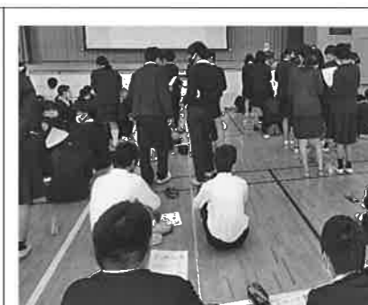
2020.11.24 喜多小学校 (96名対象)