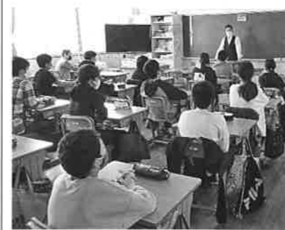
2020.11.27 久米小学校 (24名対象)