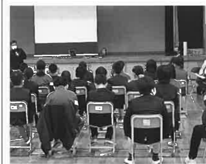
2020.11.26 内子小学校 (61名対象)