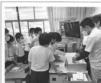
2020.7.3 長浜小学校 (32名対象)

『租税教室』では、税金に関するDVD鑑賞や税金クイズ、また1億円レプリカ体験等、青年部会員が工夫をこらした授業を行い、児童・生徒に税金について楽しく学んでもらっています。