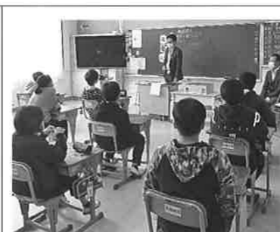
2020.11.13 平野小学校 (18名対象)