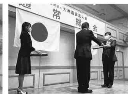
(伊予銀行内子支店様)