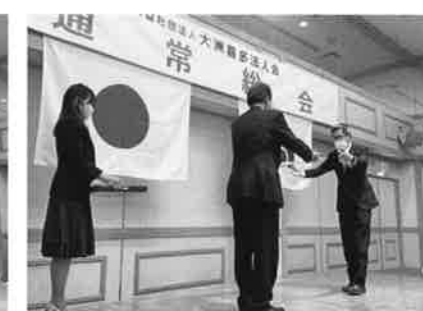
(愛媛信用金庫大洲支店様)