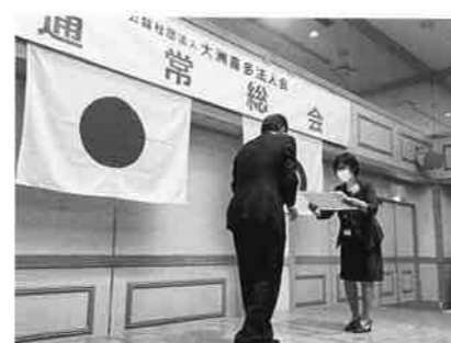
(愛媛銀行大洲支店様)