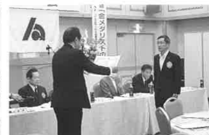
会員増強表彰愛媛信用金庫大洲支店