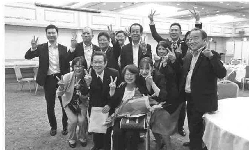
みんなでピース！記念撮影