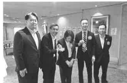
受賞された金融機関の皆様と