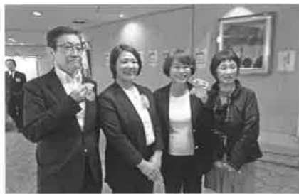
佐々木女性部会長と谷本講師