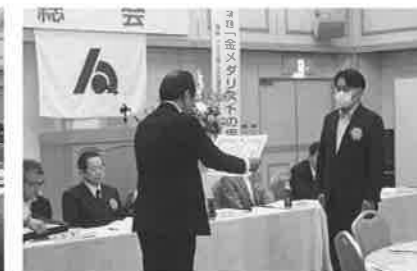
会員増強表彰伊予銀行内子支店