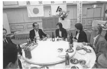
和やかな歓談・懇親の時間