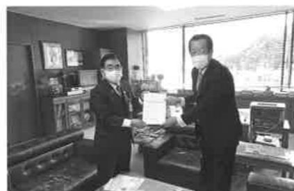
久保会長が大洲市長に税制改正要望書提出