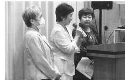
右から三井新部会長と 猪川新副部会長、大田副部会長