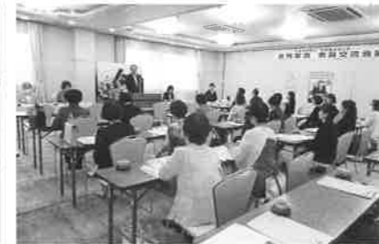
久保会長のあいさつ