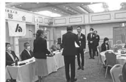
会員増強表彰伊予銀行大洲支店