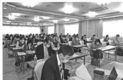
電子帳簿保存法セミナー