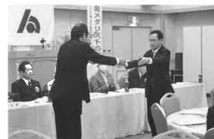
会員増強表彰愛媛銀行大洲支店