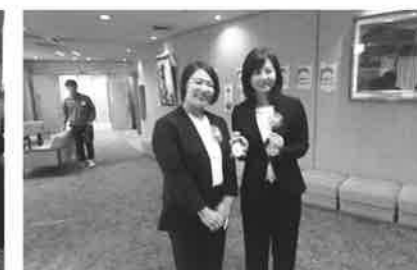
大洲税務署長と谷本講師の2ショット