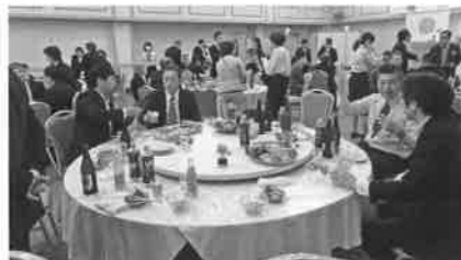
久しぶりに盛り上がった懇親会