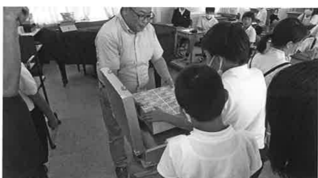
新札ではないけど「1億円レプリカ」