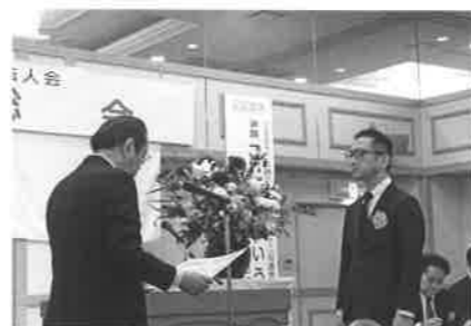
会員増強表彰 伊予銀行大洲支店殿