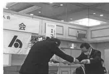
会員増強表彰 愛媛銀行大洲支店殿