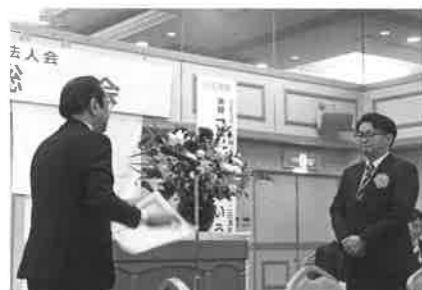
会員増強表彰 伊予銀行内子支店殿