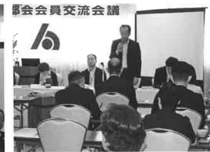
久保会長のあいさつ