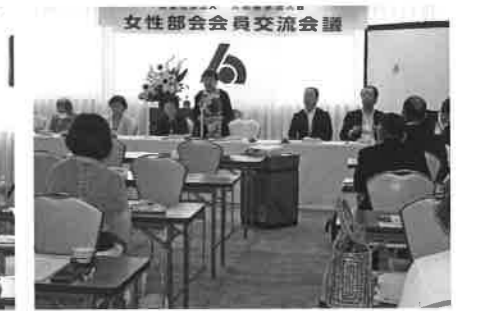
三井部会長のあいさつ