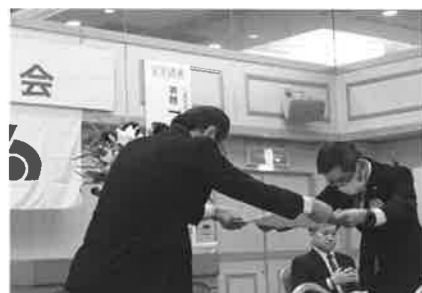
会員増強表彰 愛媛信用金庫大洲支店殿