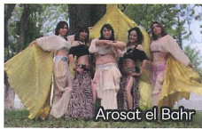
Arosat el Bahr