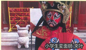
小学生変面師 来叶

12:05~ フラダンス ダンススタジオエンドレス フラ ハラウ オ マカナナレオアロハ