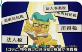
《マリンとヤマトの不思議な日曜日》