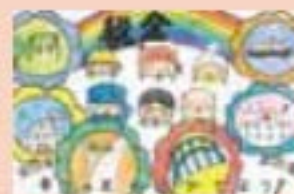
江別市立江別第一小学校 6年生