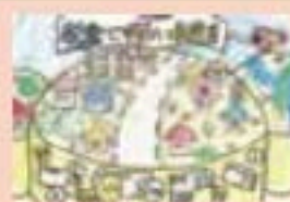
江別市立大麻東小学校 6年生