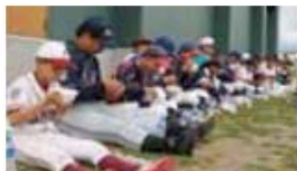
ランチタイムは豚汁でエネルギー補給!