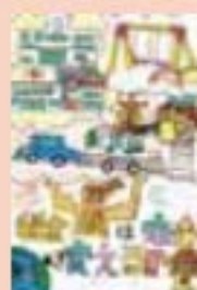
江別市立中央小学校 5年生