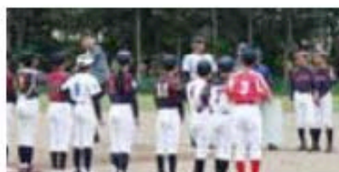
林 社会貢献委員長による始球式の様子