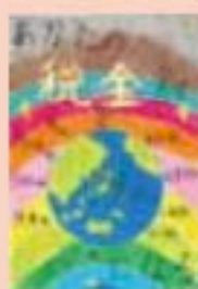
江別市立大麻東小学校 6年生