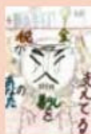
江別市立中央小学校 5年生