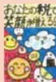
江別市立大麻東小学校 6年生