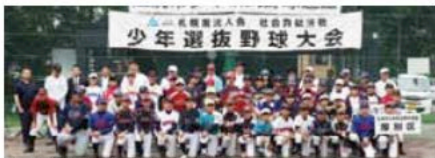
選抜選手たちと実行委員の皆さんで思い出の一枚。