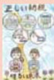
札幌市立もみじの丘小学校 6年生