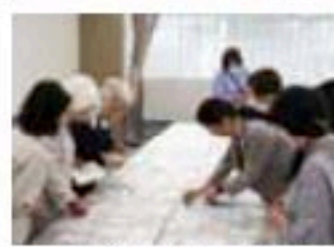
審査に真剣な選考員のみなさん