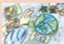
江別市立大麻東小学校 6年生