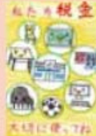
札幌市立北郷小学校 4年生