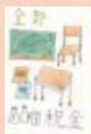
札幌市立東白石小学校 6年生