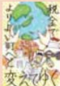
江別市立大麻東小学校 6年生