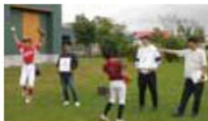
試合の合間に税金クイズで楽しみました。