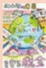
札幌市立平和通小学校 6年生