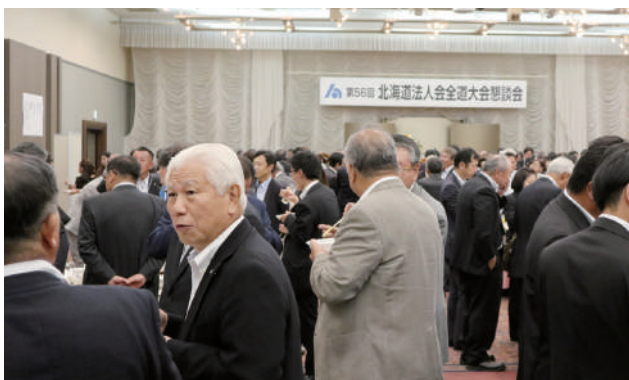
過去の大会の様子