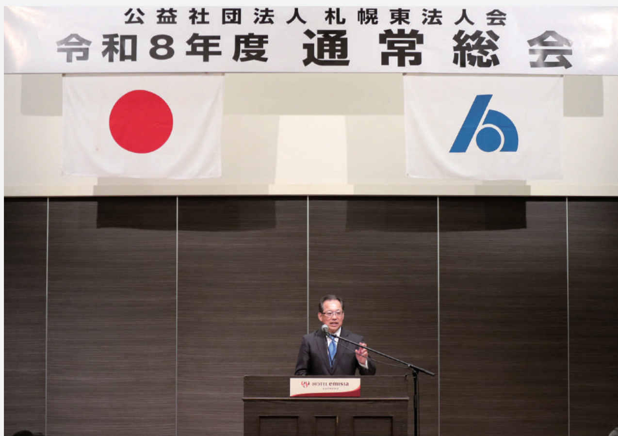
令和8年度 通常総会