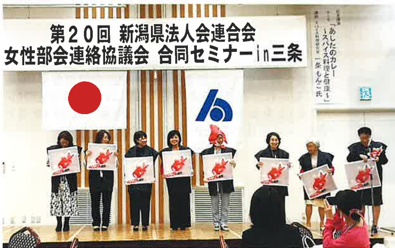
令和7年10月23日 第20回女性部会連絡協議会 合同セミナー in 三条