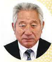
公益社団法人新発田法人会