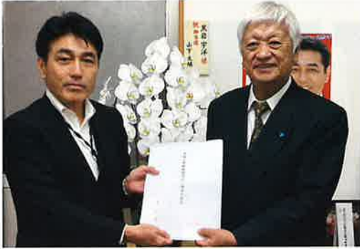
黒岩宇洋 衆議院議員