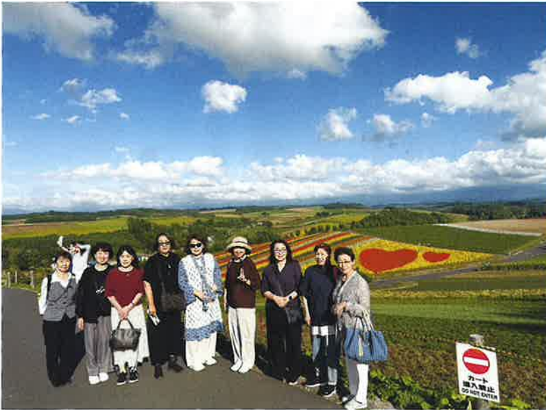
令和7年9月17日～19日 女性部視察研修 in 北海道