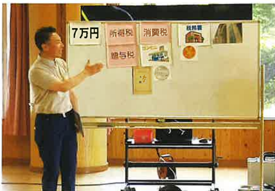
令和7年度租税教室開催校