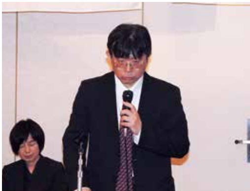
挨拶される浦広島県北部県税事務所長