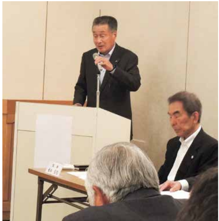
挨拶する三宅会長