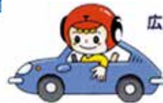
広島県税のイメージ キャラクター タツ君