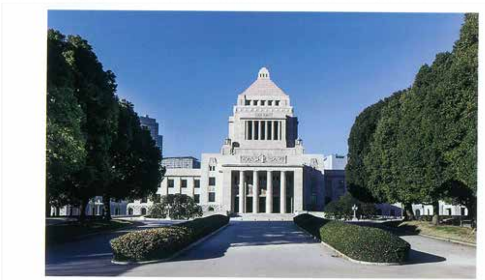
国会ホームページより

一方、「106万」と「130万」は「社会保険料の壁」とも言われています。勤務先の規模や働く時間によっては公的年金や健康保険など、社会保険料の負担が生じるためです。