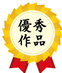
庄原市教育委員会教育長賞