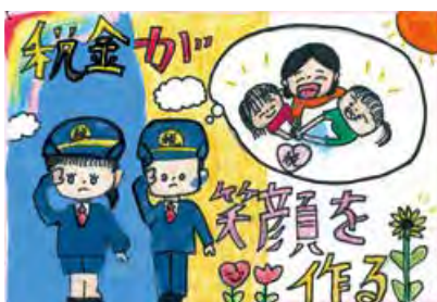
(公社)庄原法人会女性部会長賞