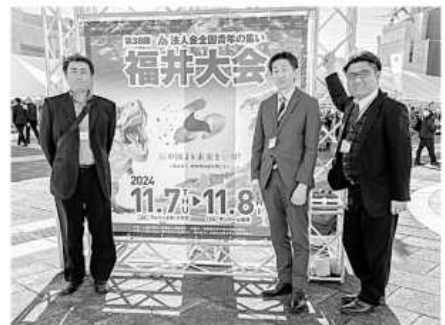
左から 青年部会 大上会員・兼光部会長・熊高副部長