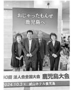
40回 法人会全国大会 鹿児島大会 2024.10.3日