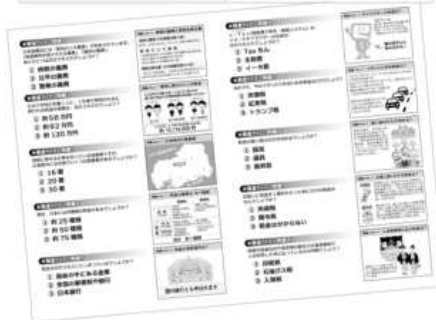
「税について考えよう！」 キャンペーンチラシ