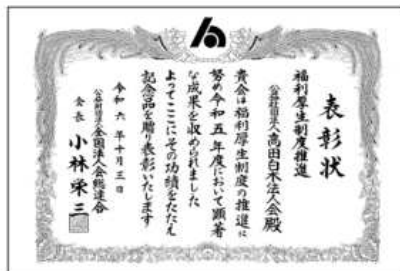
令和6年10月3日 福利厚生制度推進

令和6年10月に「令和5年度会員増強」において顕著な成績を挙げた単位会に対する表彰が実施され努力賞に輝きました。