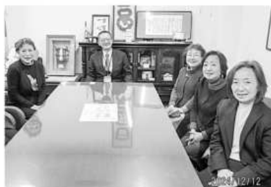
衣川税務署長と一緒に