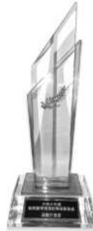
記念のクリスタルトロフィー