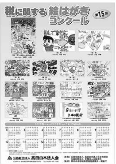
絵はがきコンクールカレンダー

令和7年度も、会員協力の基、より一層税の啓発活動に努めて参りますので、どうぞよろしくお願い致します。