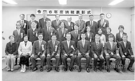
吉田税務署にて関係者記念撮影