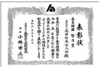
令和6年10月3日 会員増強 努力賞

令和6年10月に「令和5年度会員増強」において顕著な成績を挙げた単位会に対する表彰が実施され努力賞に輝きました。