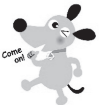
8年度も頑張るワン

明るく健全でいつもポジティブな法人会を志向して頑張ります。皆様のご指導ご鞭撻のほどお願い申し上げます。