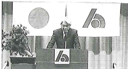
千葉税務署長講演会