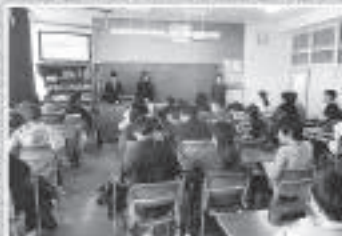
女性部会/所沢支部租税教室