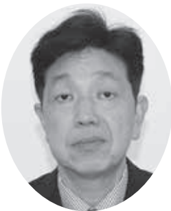
傳 川 署 長