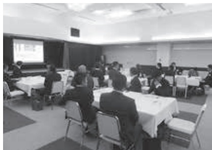
セミナー開催の様子

その後講師からBCP対応に係る各種具体的説明がなされ、会場参加者は「不測の事態が発生した場合の事前の備え・ルール策定・社員に対する徹底・訓練」等の重要性を改めて実感でき、今後の自社の事業継続力を向上させる貴重な機会となりました。