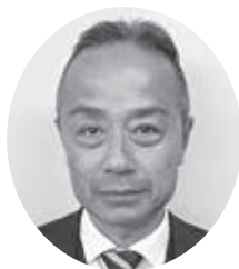
新井副支部長(所沢)