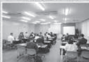
新設法人税務研修会