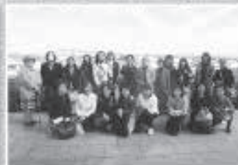
女性部会/会員一日研修会