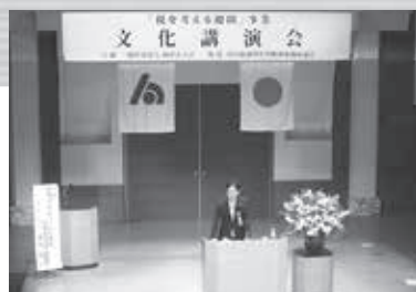
所沢税務署長講話

講演会の最後には、会場の参加者2名に対するゴルフスイング公開レッスンも開催された他、会場からの質問に対しても丁寧にお応えいただき、ゴルフ愛好家にとって大変有意義な講演会となりました。