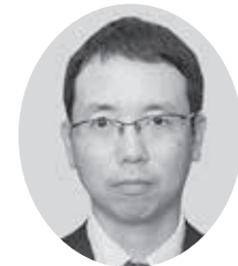
月井副支部長(入間)