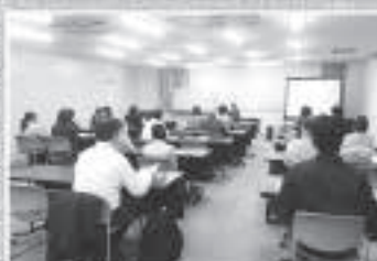
法人税・消費税申告説明会