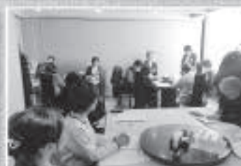
女性部会/第3回役員会