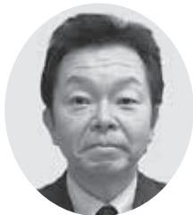
高柳副支部長(狭山)