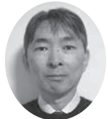
福島副支部長(入間)