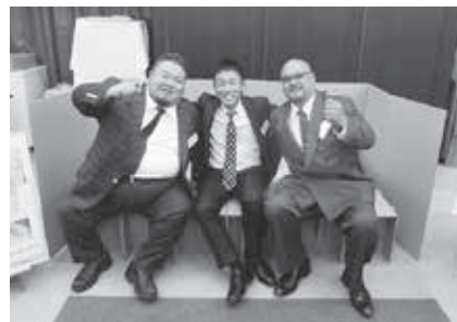
防災グッズの上で記念撮影