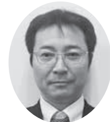
松丸副支部長(飯能)