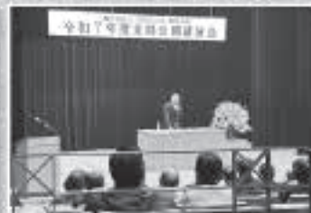
飯能支部/公開講演会