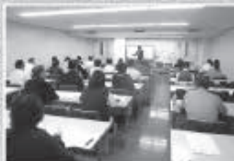
年末調整セミナー