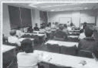
税制改正セミナー