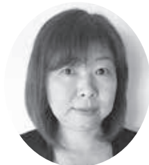
神保副支部長(入間)