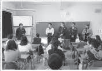
青年部会/所沢支部租税教室