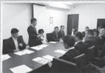
青年部会/下期役員会