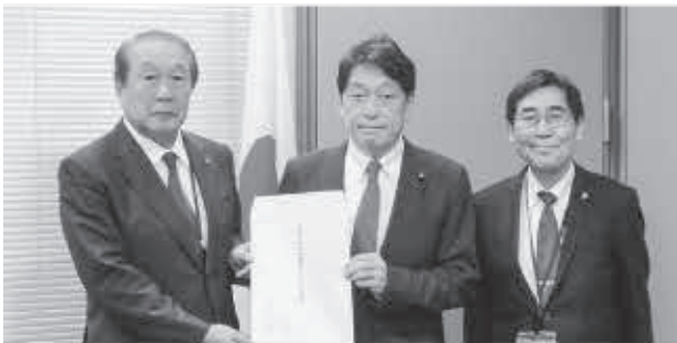
左から飯野税制委員長、小野寺税制調査会長、田中専務理事