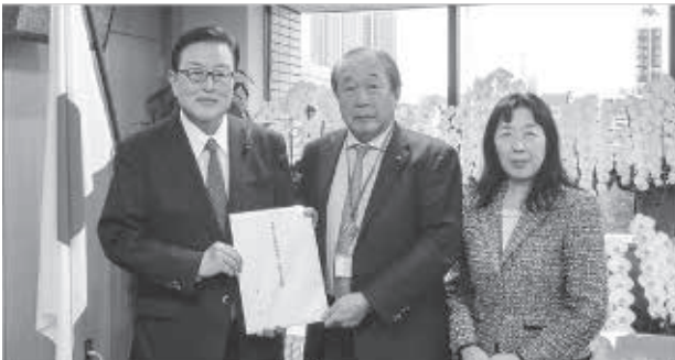
左から長坂厚生労働副大臣、飯野税制委員長、丸山税制副委員長