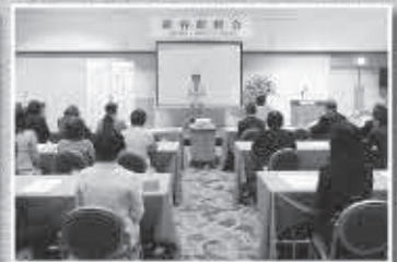
女性部会/新春研修会