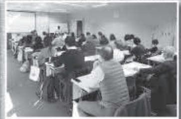
法人税・消費税申告説明会