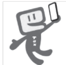
スマホでもできるよ!