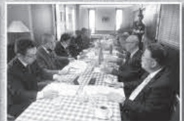
組織厚生組織厚生委員会