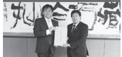
写真左から、小野塚市長、日向副会長