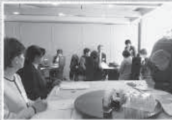
女性部会/第4回役員会