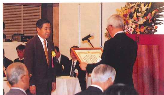
中富会長へ感謝状