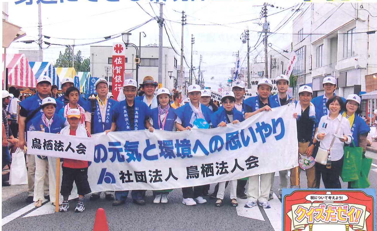
まつり鳥栖会場で

最近、真夏日、熱帯夜が続いていますが、これも環境破壊のせい？ 鳥栖法人会は、平成9年から社会貢献活動の一環として、毎年各支部管内で開催されるお祭りや伝統行事に参加して、私たちにできる環境保全活動をPRしています。 台所で簡単に使用できる法人会オリジナルグッズ「水切りネット」と家庭で「税について」楽しく学べる教材として「クイズだぜい！」を会場の皆さんに配布しています。 私たちの自然環境は私たちが守りましょう！！