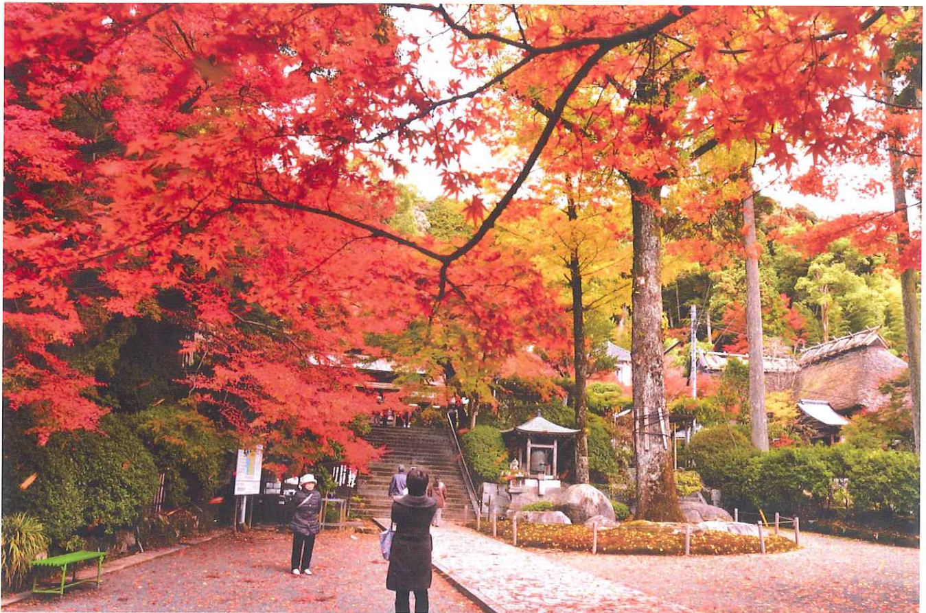
紅葉に包まれた大興善寺

基山町園部にある大興善寺（神原玄應和尚）は、奈良時代の養老元年（717年）、行基が刻んだ十一面観世音菩薩を本尊とした古刹です。平安時代、火災により建物は焼失したが、承和14年（847年）、円仁和尚により無事であった本尊を安置し再興、お寺の名前も「大興善寺」と命名。以来天台宗となり、脊振山から宝満山・英彦山へと続く、山岳仏教の修行コースの拠点として崇められました。