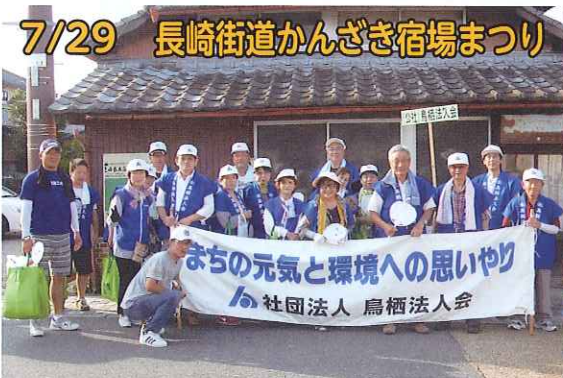
大石会長も参加いただき、長崎街道847mを1時間以上かけてのパレード。最高の暑さの中、みなさん元気にゴールしました。

梅雨明けの土曜日。皆さん「暑い、暑い！」を連発しながら歩きました。31名参加、水切りネット400個配布しました。