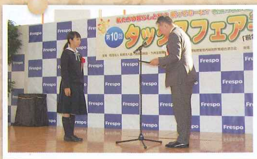
税についての作文 鳥栖税務署長賞授与