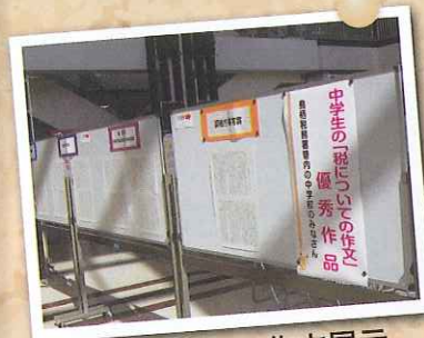
税についての作文展示