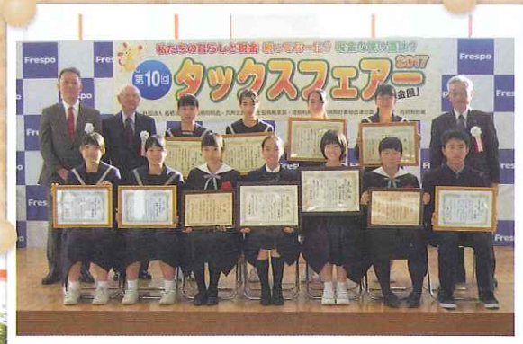
←税についての作文 受賞者のみなさん