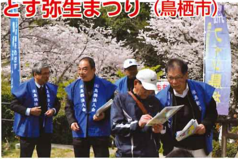
来場者へ税金クイズ配布