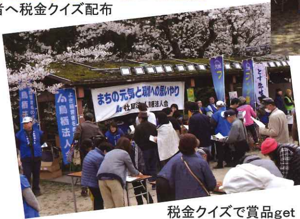
税金クイズで賞品get!