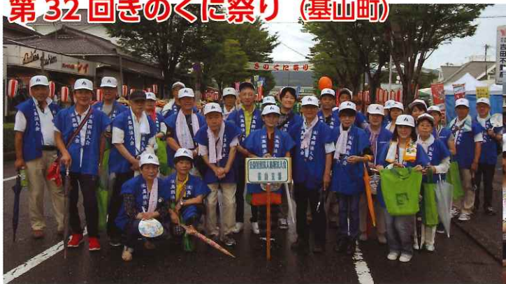
鳥栖税務署4名、法人会27名が参加