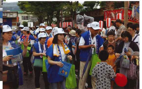
↑水切りネット400個配布