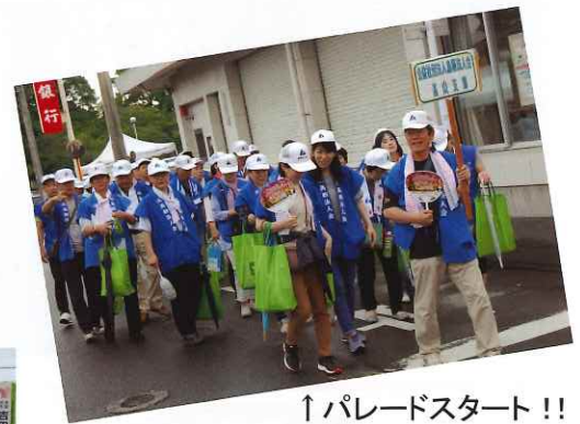
↑パレードスタート!!