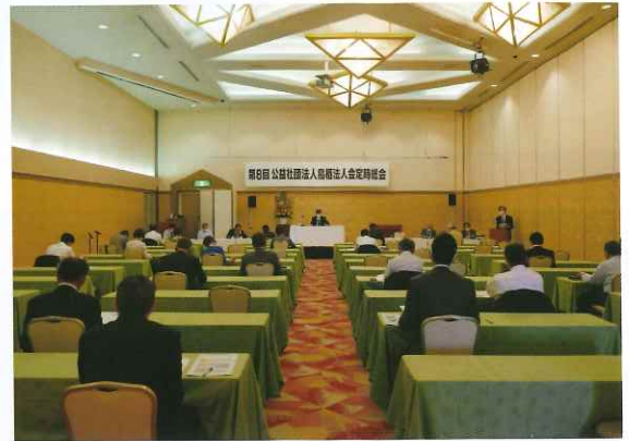
出席者は間隔を空けての着席