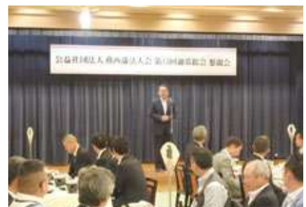
【細川間税会副会長より乾杯のご発生】