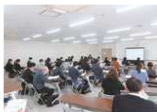
於：吉田産業会館 第1 会議室