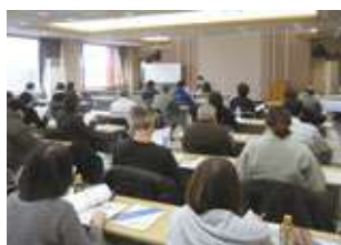
於：燕商工会議所 ホール

巻税務署のご協力により、四半期毎に開催しています。税制改正による変更点などを中心に説明頂きながら、法人会が配付している「自主点検チェックシート」の活用を推奨して頂いています。社内監査欄への記入をお忘れなく。