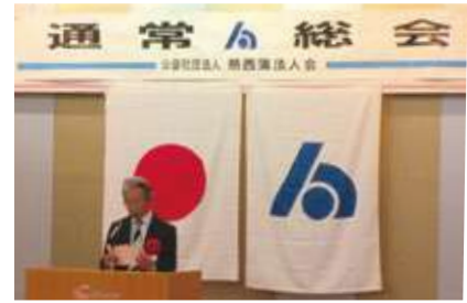
【来賓祝辞：大滝県税部副部長】