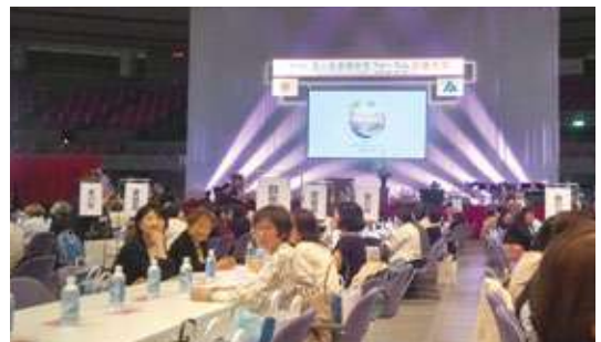
【会場の広島グリーンアリーナ】