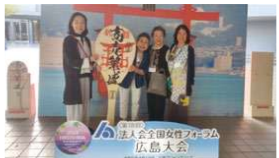
【会場前で記念撮影】

令和6年度 「税に関する絵はがきコンクール」 今年もたくさんの応募を待っています