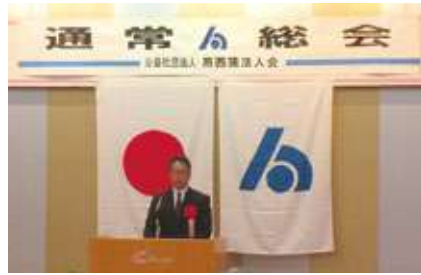
【来賓祝辞：濁川税務署長】