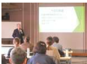
松山講師セミナー風景

インボイス制度との関連なども、税理士ならではの視点からのお話も興味深く、参加者の皆さんも真剣に聞き入っているようでした。セミナー終了後には質問タイムもサービスして頂きました。