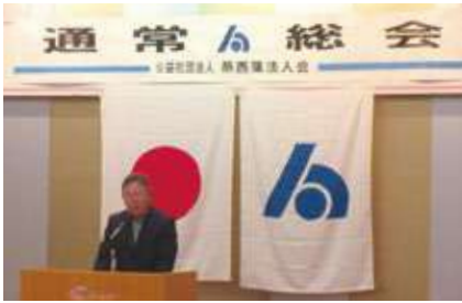
【開会挨拶：和田会長】