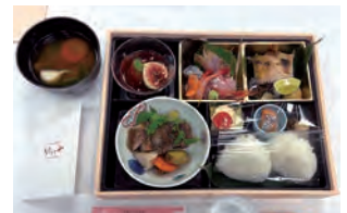
地元の食材を使った料理