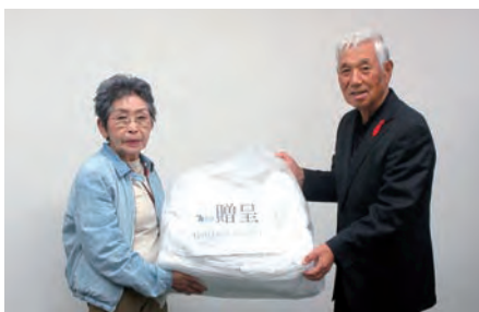
(長谷川女性部会長からタオル贈呈)