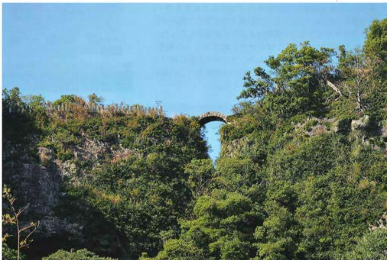
天念寺「無明橋」

公益社団法人 宇佐高田法人会 〒879-0456 宇佐市大字辛島 198-2 Tel. 0978-34-9898 Fax. 0978-34-9477 E-mail: ho-usata9898@earth.ocn.ne.jp